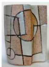
構成 1955年 初期の作品