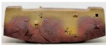
皓 1996年 第8回日展特選